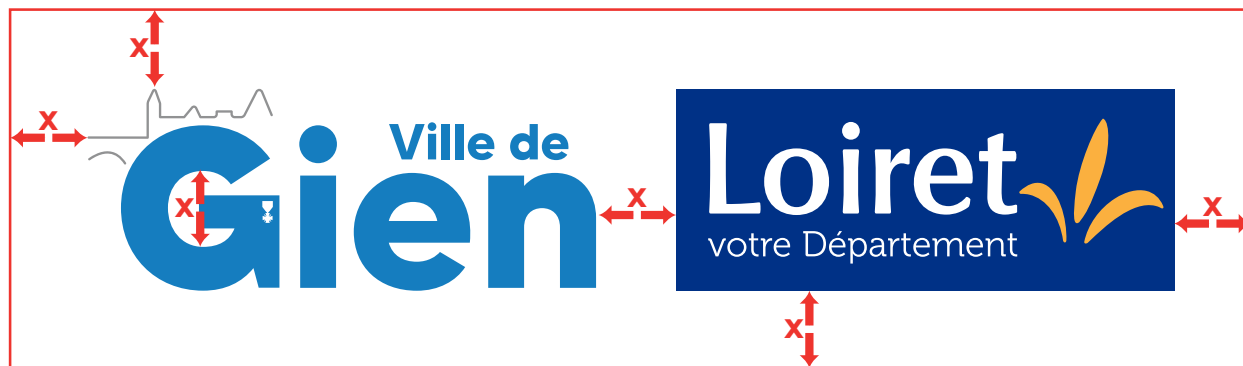
Lorsque la Ville de Gien est à l'initiative de l'opération

Quoiqu'il en soit, la taille des deux logotypes doit être ajustée pour présenter un parfait équilibre entre les deux éléments.